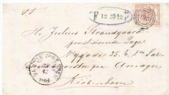
Skibsbrev 24. december 1864 fra Dampsk. Post. Ex/Rute no 3, nummerstempel 190 til Sundbyvester på Amager, udbragt af FP (S-OVA).

Postloven af 26. september 1865 tillod fodpostmærket 2 sk anvendt frit som frankering sideordnet med rigets øvrige frimærker til almindelige portobehov, kontant frankering ophører i 1868. Hvor det af stor betydning for FP-kontoret bestemmes, at Fodpostkontoret fremover tjener som ekspeditionskontor for alle forsendelsestyper, og andre ekspeditionskontorer tillige skal modtage bypost. Brevmængden øges betragteligt i disse år, helsagerne kommer til med konvolutten (1865) og brevkortet (1871). Mens Fodpostkontoret fra da af i sagens natur mistede sin betydning. Med helt omorganiseret budtjeneste samtidigt løstes et hastigt påtrængende problem i København med den rivende udvikling i omegnen, hvorefter kontoret blev nedlagt primo marts 1876 som overflødig. På min fortegnelse ses et spidsovalt stempel FP S-OVA, uden årsangivelse, brugt i tiden 1. oktober 1864 – 15. juli 1865, og de to tilkomne stempler fra 1867 FP VIII samt et lapidarstempel (FP Lap), der som dagstempel formentlig er brugt i budstuen til rutemarkering. Stempelsvæerten er sort før frimærketiden, fra 1849 efter tilbagekøbet altovervejende blålig/blå. Stempelfarven har - udover de røde - grønblå, blå eller sort ikke postal betydning, efter 1871/72 ses (omtrent) udelukkende sort sværte anvendt. En del af disse posthistoriske emner er nærmere behandlet i hæftet om Fodposten København 1806-1876, udgivet ved årsskiftet 2023-2024 „FP Antologi“, med litteraturhenvisninger.